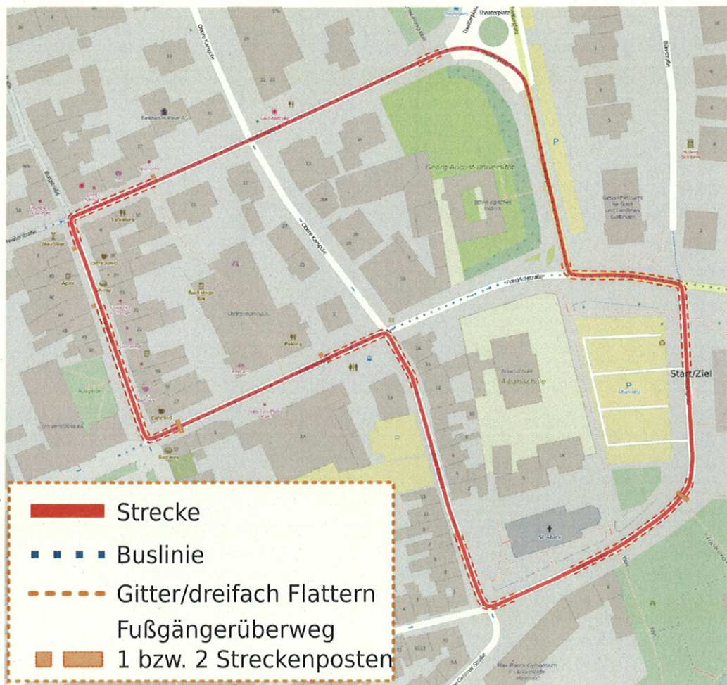
Streckenplan: Rund am Wilhelmsplatz